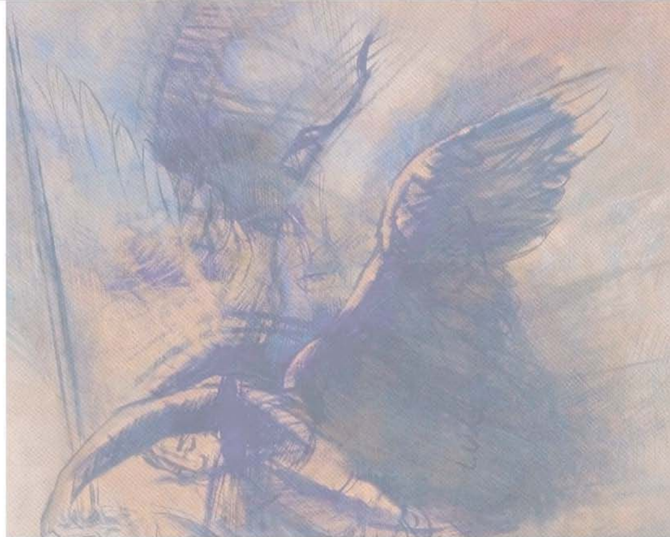
KUNSTWERKE: DAVIDO (PROVINZ); KUNSTWERKE: ALTE MEISTER DER STAATLICHEN KUNSTSAMMLUNGEN DRESDEN; GRAFISCHER ALTE MEISTER; KUNSTWERKE: WÜRDEMEISTER; KUNSTWERKE: WÜRDEMEISTER